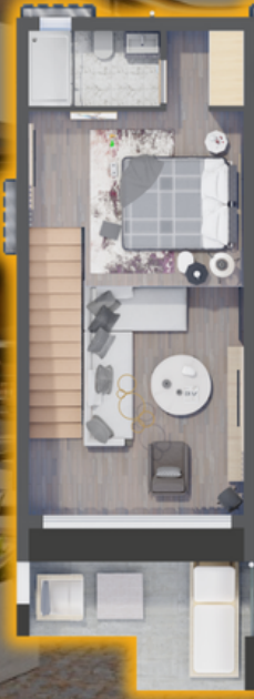
طاقه بالا (لافٹ)